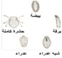
دورة نمو قملة النحل