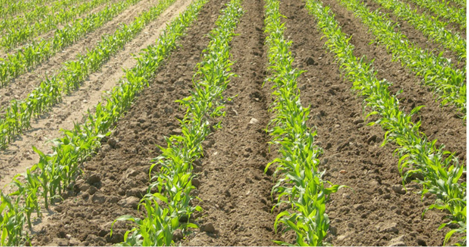
الصورة رقم 9: حقل للزرع المباشر يبين التدبير الجيد لبقايا زراعة الذرة

تعتبر هذه العملية ذات أهمية قصوى في نظام الزرع المباشر لأن هناك تجاذب بين نسبة الإنبات وهيئة النبتة وقوتها وطبيعة هذا التدبير. فوجود نسبة عالية من البقايا (التبن) على سطح التربة يمكن أن يحد من نسبة الإنبات و من تكوين الجذور لدى البذور، وكذلك حماية سطح التربة من التأثيرات المناخية (الشتاء، الرياح، الحرارة، الأشعة) والحفاظ على خصوبتها. وديمومة اسغلالها لا تتم إلا بوجود كمية ملائمة من البقايا على سطح التربة. لذا على المزارعين أن يلتفتوا إلى أهمية هذه البقايا في استثمار واستغلال أراضيهم الفلاحية على المستوى البعيد والمتوسط.