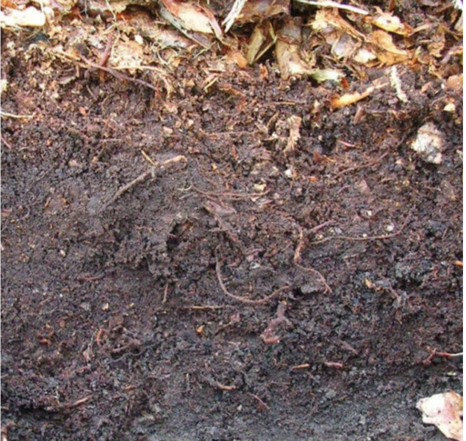
الصورة رقم 1: تلعب بقايا المزروعات دورا مهما في تحسين بنية التربة والمحافظة على الماء