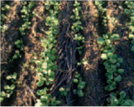
الصورة رقم 8: كولزا بالزرع المباشر بعد زراعة الحبوب بمنطقة حد السوالم بالشاوية

لا بد من احترام الدورة الزراعية في نظام الزرع المباشر. ويتم اختيار الزراعات المكونة للدورة الزراعية حسب الظروف الزراعية والمناخية والاجتماعية والاقتصادية. ويعتبر أسلوب الزراعة الوحيدة المعتمدة من طرف الكثير من المزارعين أحد أسباب المشاكل، والتي يعاني منها إنتاج الحبوب بالمناطق الجافة وشبه الجافة والمتعلقة بالنقص في خصوبة التربة وانتشار الأمراض والحشرات وتكاثر الأعشاب الضارة، وعلى الخصوص تلك المقاومة للمبيدات العشبية. وتعتبر الدورات الزراعية التي تعتمد على زراعة الحبوب بالتناوب مع زراعة القطن أو زراعة الكلاً أو الزراعات الزيتية من الدورات الزراعية الأكثر ملاءمة للمناطق شبه الجافة.