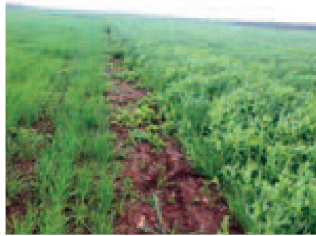
الصورة رقم 7: خليط كلثي من الجلبانة والشعير بالزرع المباشر بمنطقة كدانة