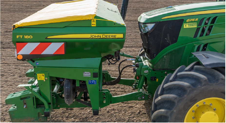
الصورة رقم 3: بذارة مجهزة بالأقراص

بذارات مجهزة بالأقراص: تعتبر من الأنواع الأكثر انتشارا على الصعيد العالمي. من خصائصها القيام بالزرع المباشر بأقل خلخلة للتربة وهي جد فعالة في حالة وجود غطاء نباتي مهم.