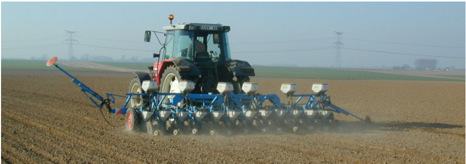
الصورة رقم 4: زرع مباشر في تربة جافة بمنطقة تامدروسة بجهة الشاوية

يمكن الزرع المباشر من وضع البذور في تربة جافة مع ضمان إنباتها ويزوغها دون صعوبة، كما يمكن أيضا في حالة هطول الأمطار مبكرا من الدخول إلى الحقل بسرعة مقارنة مع التربة المحروثة.