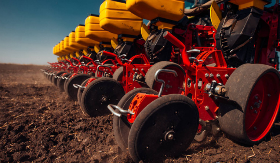
الصورة رقم 2: بذارة الزرع المباشر المغربية